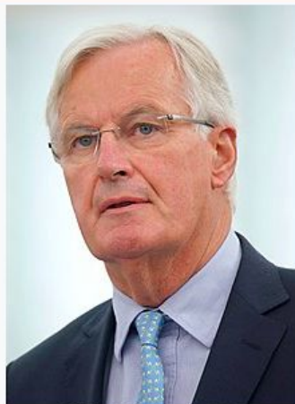
Michel Barnier en 2019.